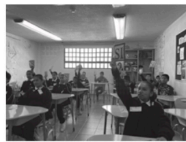
Concurso de ortografía