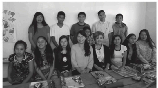
Unión Bíblica Edo de México