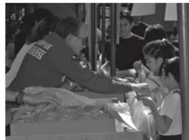
Donadores activos ayudando en el festival