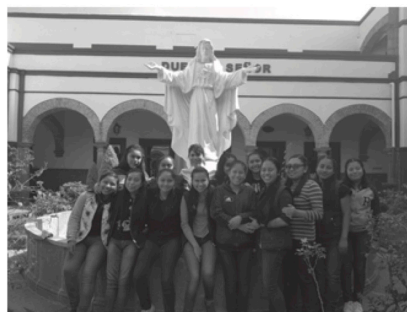
Casa Hogar Yermo Y Parres Puebla