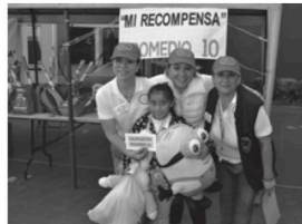
Carpa Mi Recompensa. Regalos especiales a los mejores promedios