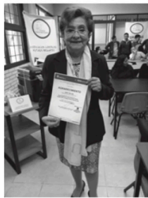
Recibimos un Reconocimiento por parte de la Escuela CECYTEM Nicolás Romero II,