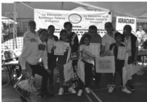
Entrega de premios a ganadores con el apoyo de miembros del Consejo