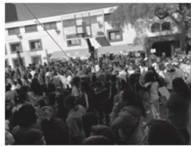
Se separan las categorías