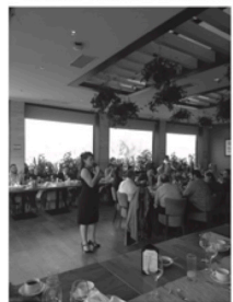
Presentación ante empresarios de BNI Tetech