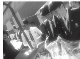
Jóvenes recibiendo con gran entusiasmo sus regalos.