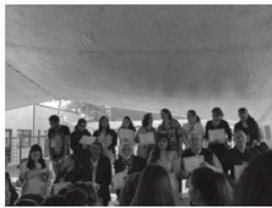
Inicio con entrega de reconocimientos a voluntarios