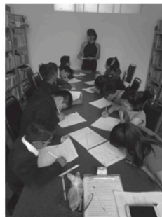
Centro Flaymar, Ciudad de México