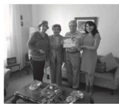
Entrega de reconocimiento a la Fam Parres por su apoyo incondicional desde hace 20 años.