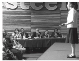
Inician los concursos