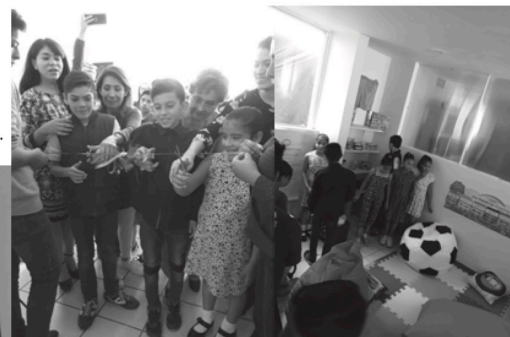
Corte de listón con los representantes de Bosch y los niños de la casa También se destinó un espacio como ludoteca

3era Biblioteca Num. 39 Fundación Paidi, Santa Cruz Acayucan, Azcapotzalco. Beneficiarios 45 niños y niñas de bajos recursos.