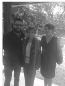
Ampliando la red de ayuda visitando nuevas casas hogar para invitarlas a recibir nuestro apoyo. Ayudante al niño