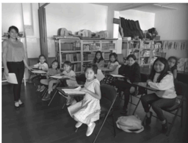
Casa Hogar Amparo Ciudad de México

Los resultados fueron analizados por el Consejo Directivo quien sugiere que no se canalice el recurso económico directo a la casa sino que la fundación adquiera los artículos escolares y personales de acuerdo a un catálogo que se le hará llegar al niño para que pueda elegir personalmente lo que necesita para asistir con dignidad y feliz, a la escuela.